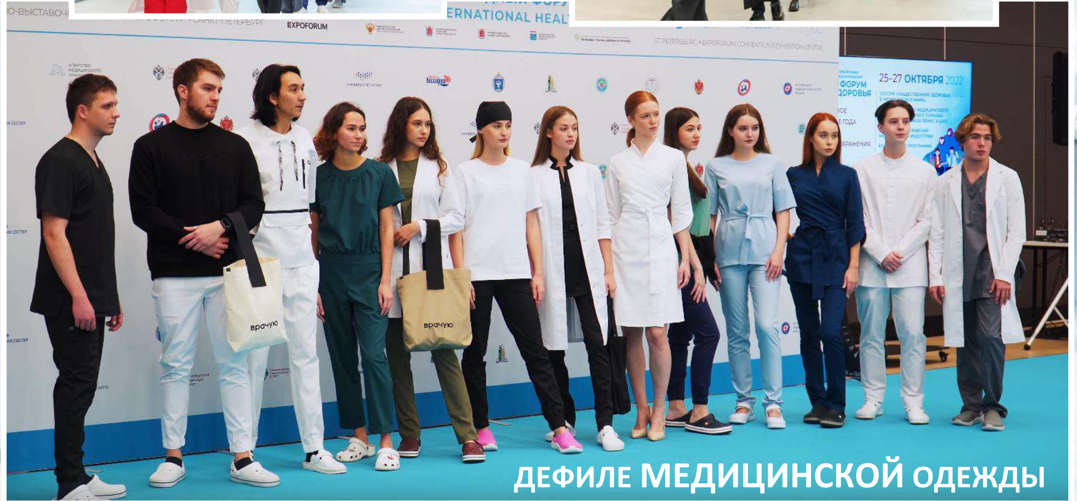
ДЕФИЛЕ МЕДИЦИНСКОЙ ОДЕЖДЫ